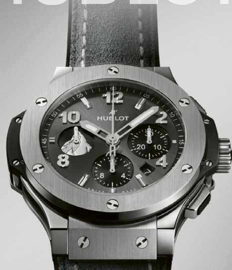
BIG BANG STEEL ZERMATT

HUBLOT HUBLOT ZERMATT BOUTIQUE Bahnhofstrasse 27