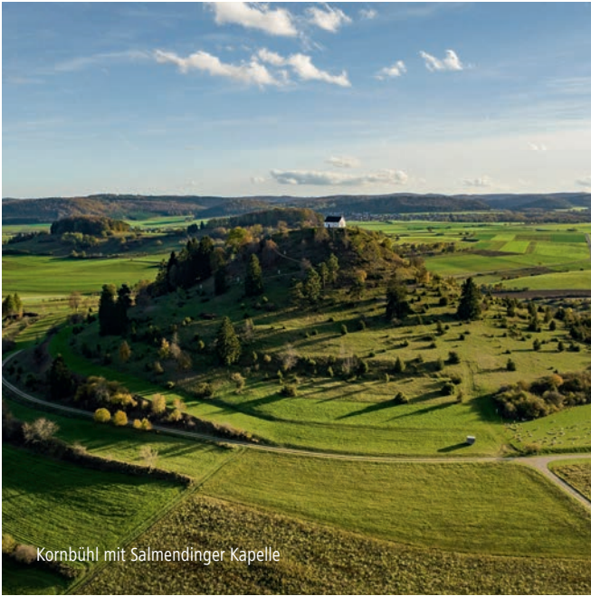
Kornbühl mit Salmendinger Kapelle

Hier bei uns auf der Zollernalb kann man den Horizont im Wortsinne erweitern, denn die Fernsicht reicht bis zu den Alpen. Das macht Lust auf mehr. Und auf die Natur mit ihren herrlichen Tälern, den sanften Hügelketten, den schroffen Bergen und den Felsen. Kein Wunder also, dass für Wanderer und Radfahrer ganz einfach der Weg das Ziel ist. Wo geht's lang? Das kann man so pauschal nicht beantworten. Denn die einen möchten in ihrem Urlaub einen Gang runter schalten, die anderen auf Hochtouren laufen. Möglich ist beides, hier oben.