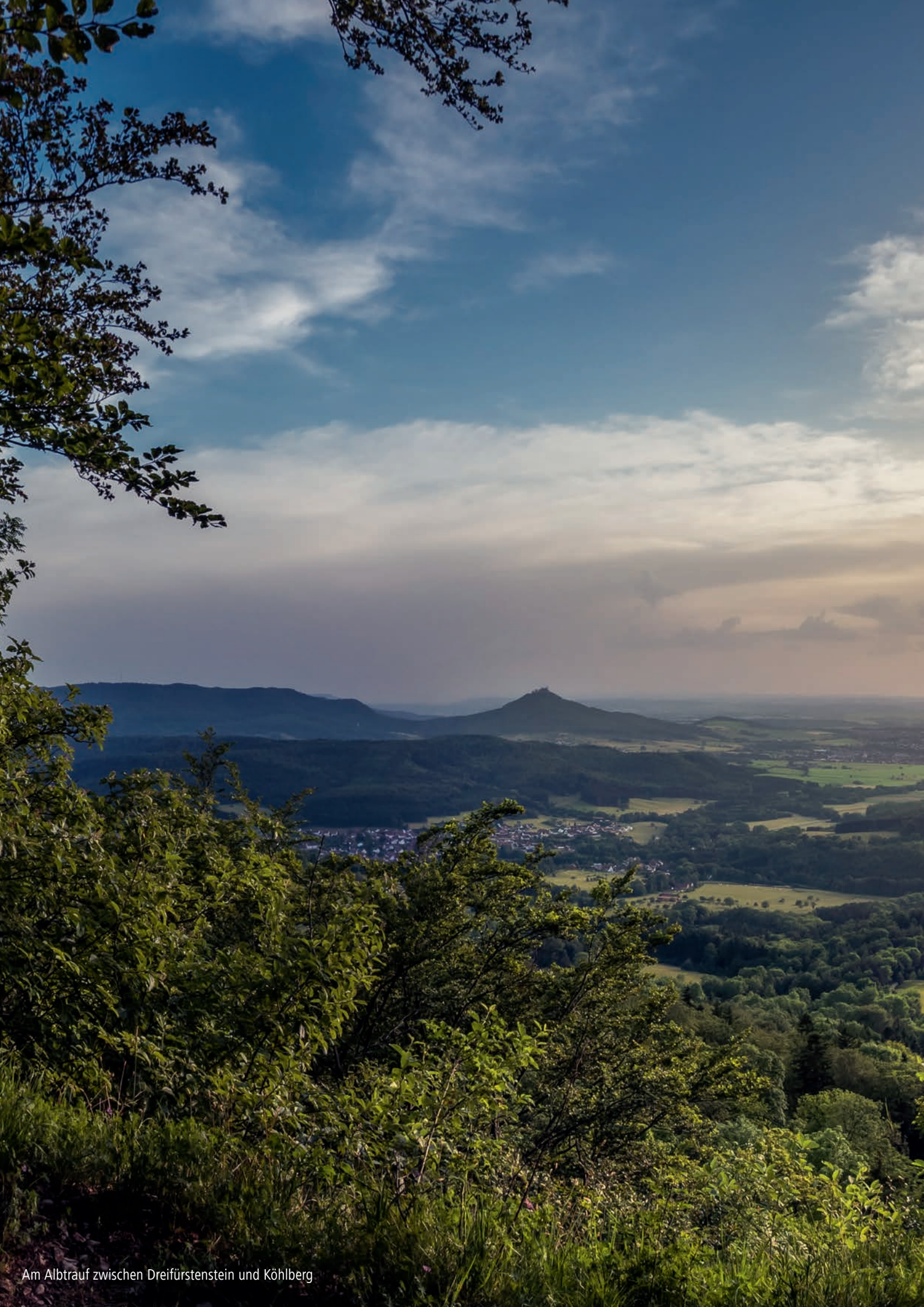
Am Albtrauf zwischen Dreifürstenstein und Köhlberg