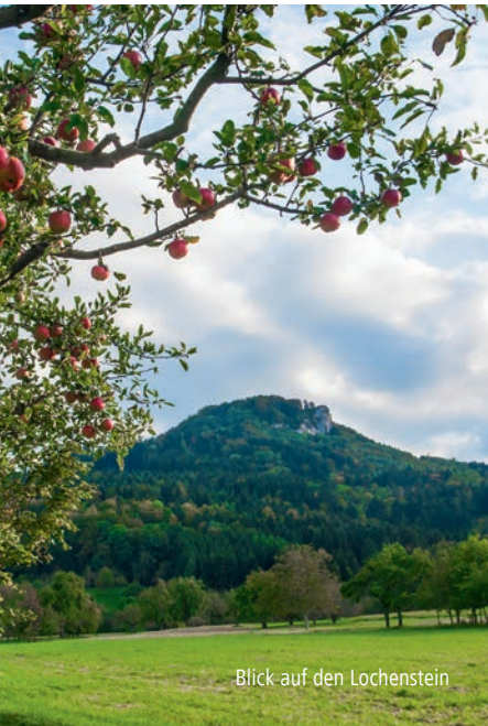
Blick auf den Lochenstein