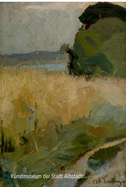
Kunstmuseum der Stadt Albstadt