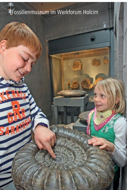
Fossilienmuseum im Werkforum Holcim