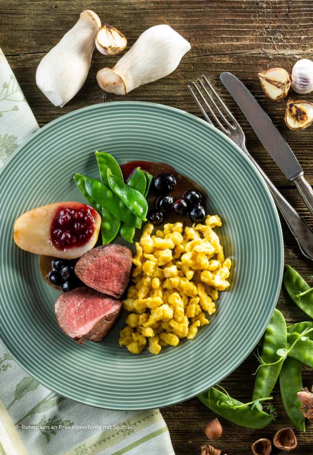
Rehrücken an Preiselbeerbirne mit Spätzle