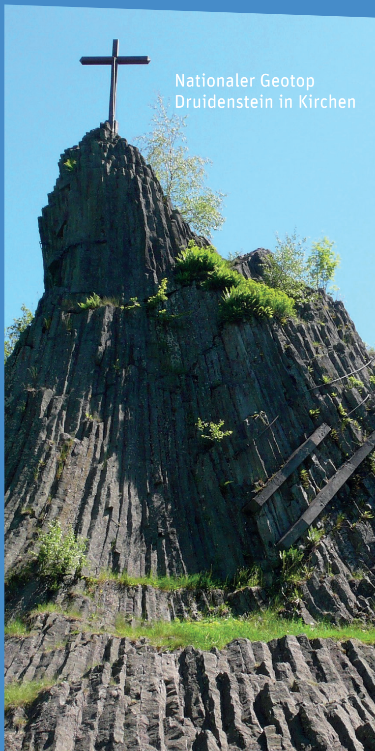
Nationaler Geotop Druidenstein in Kirchen