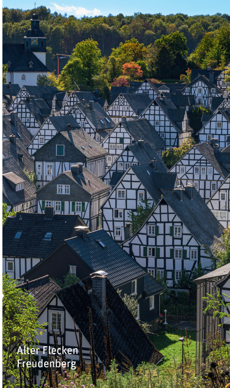
Alter Flecken Freudenberg