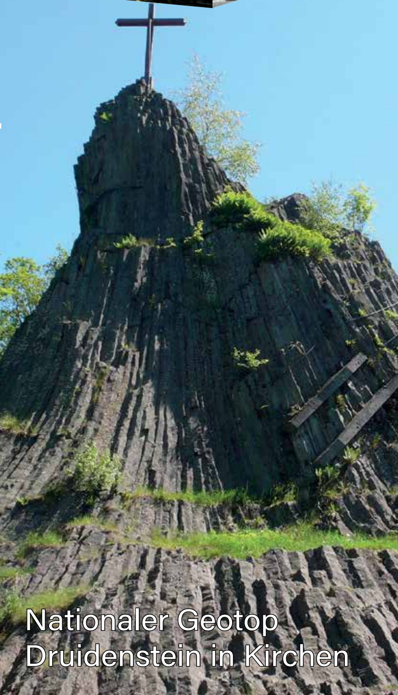
Nationaler Geotop Druidenstein in Kirchen