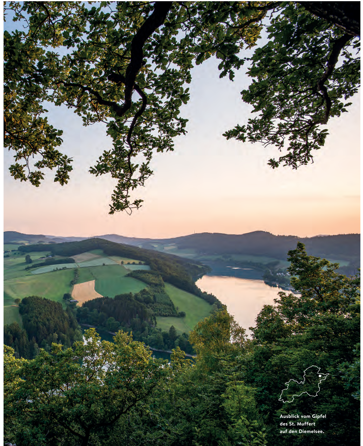
Ausblick vom Gipfel des St. Muffert auf den Diemelsee.