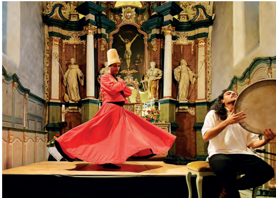
[ ← ] Momente islamischer Mystik in einer der ältesten Kirchen des Sauerlandes. Im »Spirituellen Sommer« tanzt ein Derwisch im Altarraum von St. Peter und Paul.

Bei einer Veranstaltung des Spirituellen Sommers kamen in der Kirche neben Christen auch Buddhisten, Juden, Hinduisten und Muslime zusammen. Sie sprachen über die Bedeutung des Lichts in ihrer jeweiligen Religion. »Das waren wundervoll einträchtige Momente, ich fand das stark.« Ungewöhnliche Worte von einem, der sich selbst als Konservativen sieht. Auch ihn erlebe ich als einen dieser toleranten, einladenden Begleiter, die Kraftorte zum Leuchten bringen. Und noch eine Erkenntnis nehme ich mit, als ich Wormbach verlasse: Es braucht zwar Hintergrundwissen, um einen solchen Ort zu verstehen. Aber es darf auch etwas offen bleiben. Ein paar Geheimnisse. Das lässt der Fantasie Raum zum Spielen. →