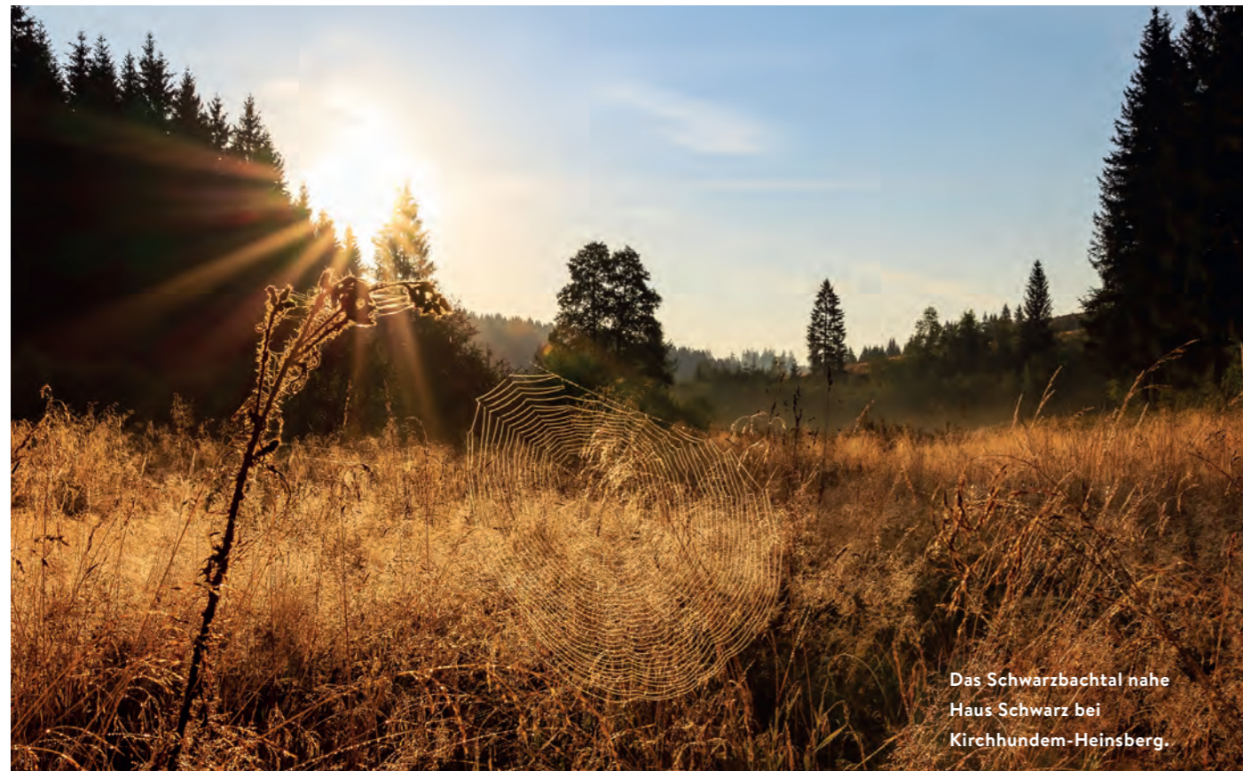
Das Schwarzbachtal nahe Haus Schwarz bei Kirchhundem-Heinsberg.

Meine Stimmung an diesen Orten, da bin ich sicher, kann an anderen Tagen auch ganz anders ausfallen. Bei anderen Besuchern sowieso. Resonanz ist nicht berechenbar. Berührung und die Antwort darauf folgen dem Moment. Und dennoch sind Gemeinsamkeiten zu erkennen: Alle Orte laden ein zum Abschalten und zur Einkehr. Es sind keine Rummelplätze. Am besten beschrieben finde ich sie mit den Worten: lebendige Stille. →