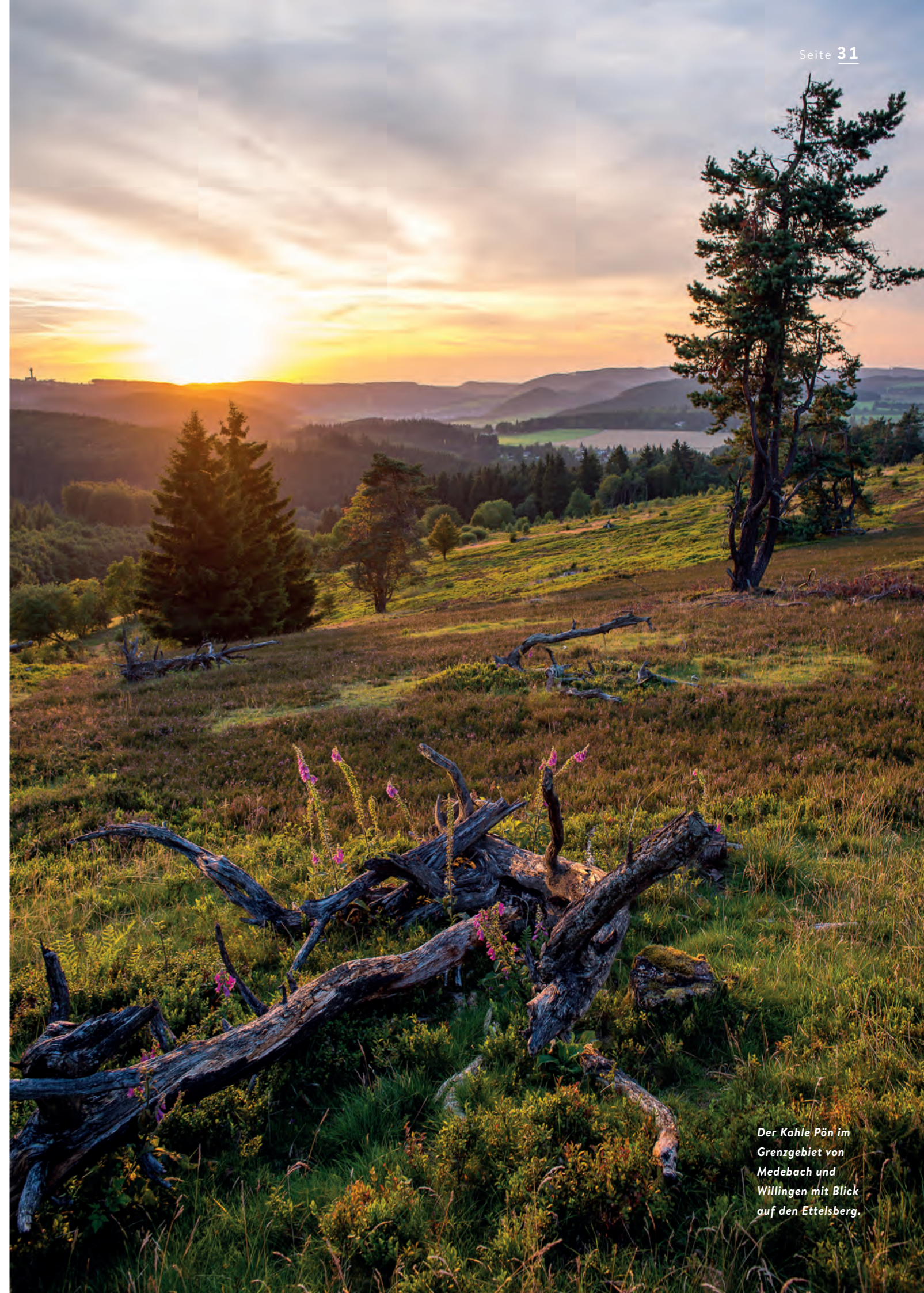
Der Kahle Pän im Grenzgebiet von Medebach und Willingen mit Blick auf den Ettelsberg.

[ ← ] Manches, was auf den ersten Blick wie Ende und Aus wirkt, ist in Wirklichkeit Wandlung.