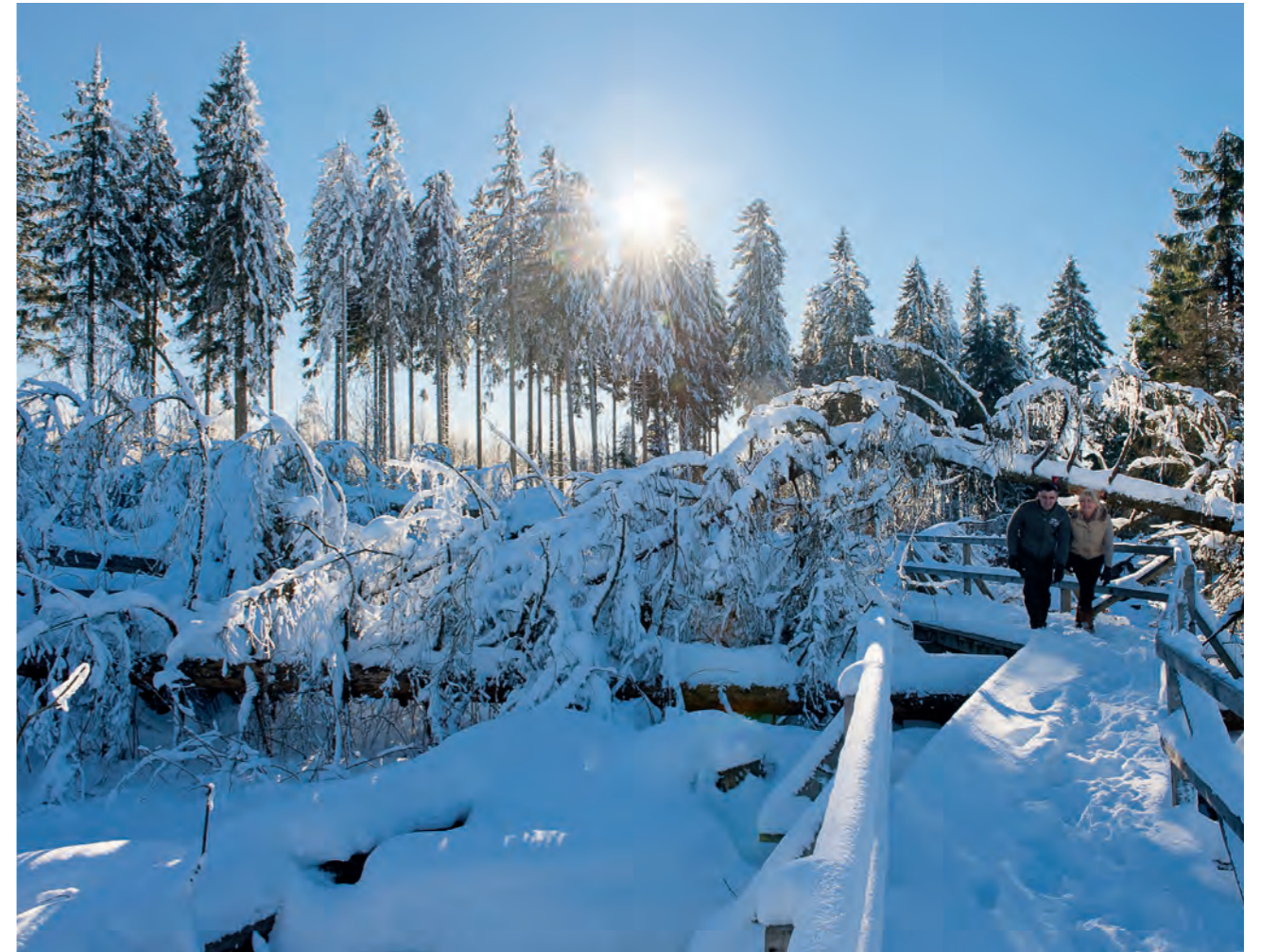
[ ↑ ] Winterstimmung auf dem Kyrill-Pfad in Schmallenberg-Schanze.

Auf exakt einem Kilometer windet sich der Pfad. Kriechen muss heute niemand mehr, die Besucher können durch Schneisen, über Stege und kleine Brücken wie durch ein Naturkundemu-