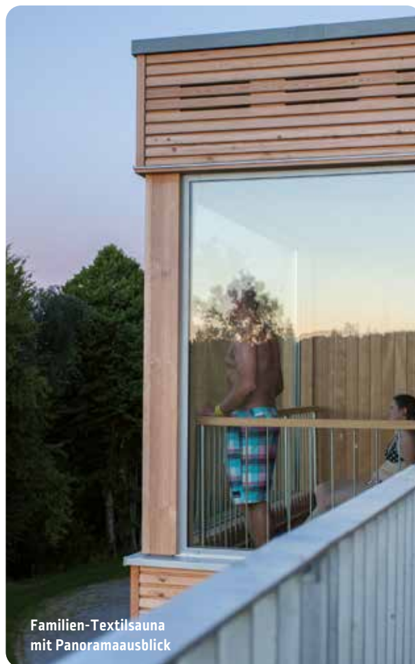
Familien-Textilsauna mit Panoramaausblick