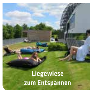
Liegewiese zum Entspannen