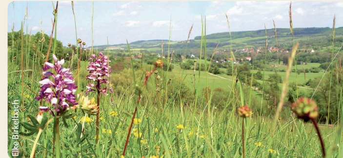
Kraina storczyków Gersheim