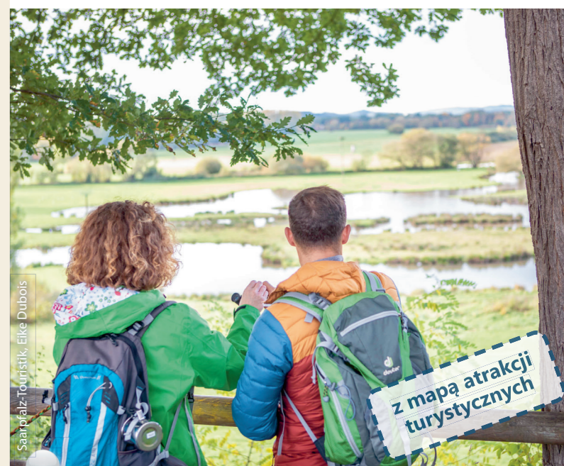
Saarpfalz-Touristik, Eike Dubois