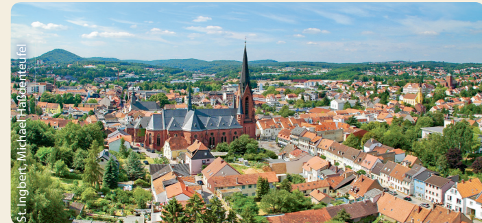
Miasto biosfery St. Ingbert