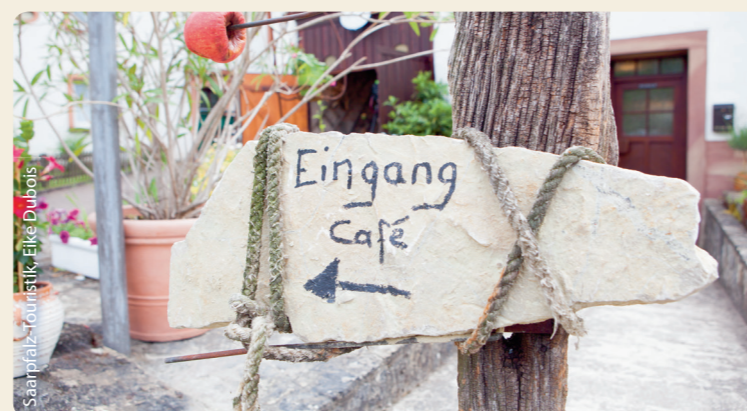
Saarpfalz-Touristik, Eike Dubois