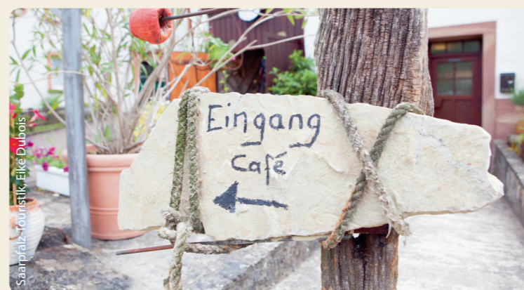
Saarpfalz-Touristik, Elke Dubois