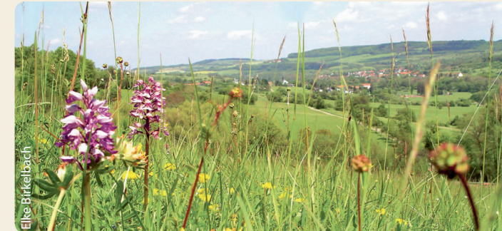
Domaine des orchidées de Gersheim