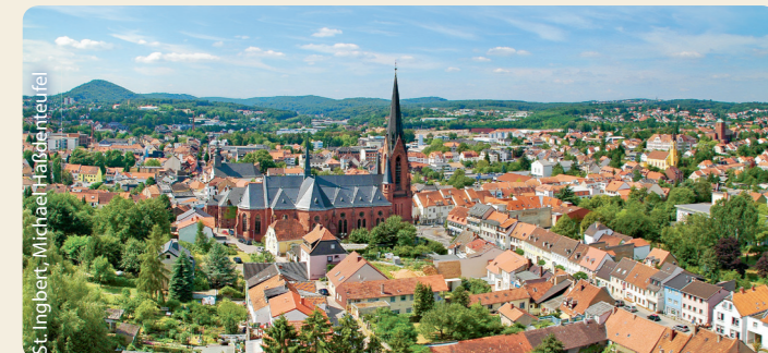
Ville de biosphère St. Ingbert