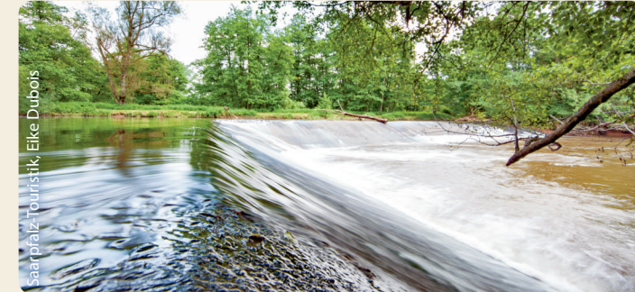
Barrage au travers de la Blies

...avoisine la forêt palatine et les Vosges du Nord. Bien qu'il ne représente qu'un huitième de la Sarre, ce petit bijou surprend par sa diversité. Ainsi, la partie sud du Bliesgau repose sur un fond marin fossile exploité depuis des siècles de façon comparativement extensive. Vastes vergers, prairies tachetées de fleurs ou somptueuses orchidées : le sud avec son paysage légèrement vallonné est un refuge pour des espèces particulièrement rares. Tout à fait différente est la partie nord où alternent de vastes forêts de hêtres dans les hauteurs avec des vallées et des formations géologiques dans le grès. Et en son cœur se trouve la Blies, encadrée le long de son cours à travers la région par un paysage de prairies à la fois romantique et sauvage à la fois. Le charme du paysage de cette région est complété par la ville moyenne de St. Ingbert avec ses lieux de culture industrielle et avec son offre culturelle.