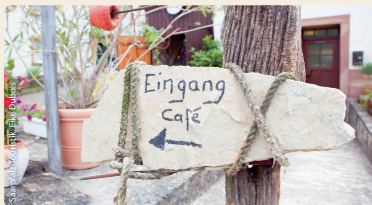
Saarpfalz-Touristik, Elke Dubois

Weitere Infos unter: www.biosphaere-bliesgau.eu