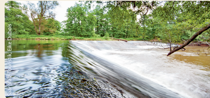
Wehr in der Blies

...liegt in unmittelbarer Nachbarschaft zum Pfälzerwald und zu den Nordvogesen. Wenngleich nur ein Achtel des Saarlandes groß, überrascht dieses Kleinod durch seine Vielfältigkeit. So stockt der südliche Bliesgau auf fossilem Meeresgrund, der seit Jahrhunderten vergleichsweise extensiv bewirtschaftet wird. Ob ausgedehnte Streuobstwiesen, bunt getupfte Blumenwiesen oder prächtig blühende Orchideen – der Süden ist Rückzugsort für ganz besonders seltene Arten und besticht mit seiner sanft hügeligen Landschaft. Ganz anders der nördliche Teil, in dem sich ausgedehnte Buchenwälder auf Höhenzügen mit Tälern und Felsformationen im Buntsandstein abwechseln. Und mittendrin die Blies, die auf weiten Strecken ihrer Reise durch die Region von einer wildromantischen Auenlandschaft begleitet wird. Der landschaftliche Liebreiz der Region wird durch die Mittelstadt St. Ingbert mit ihren Orten der Industriekultur und dem kulturellen Angebot ergänzt.