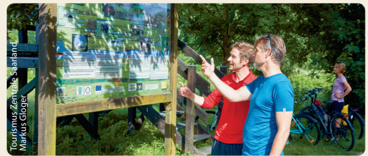
Tourismus Zentrale Saarland, Markus Gloger

Infostelle Römermuseum , Homburger Straße 38, 66424 Homburg Tel.: 0 68 48 / 73 07 77 E-Mail: info@roermuseum-schwarzenacker.de www.roermuseum-schwarzenacker.de