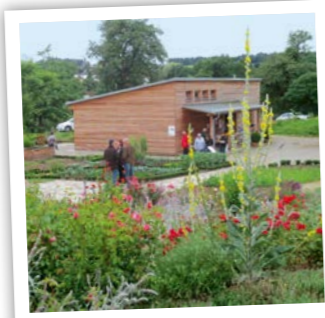
Kreislehrgarten in Fürstzell