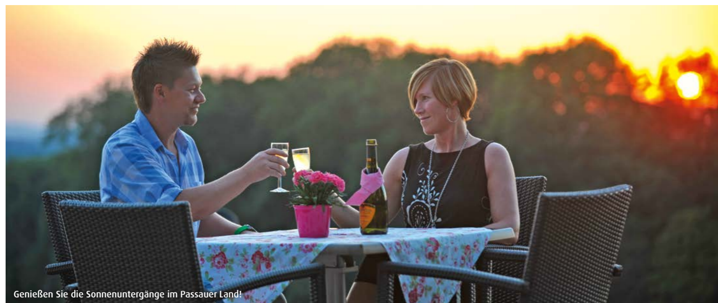
Genießen Sie die Sonnenuntergänge im Passauer Land!