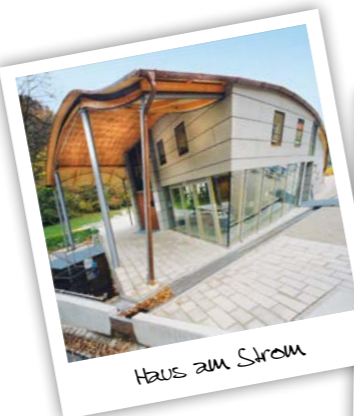
Haus am Strom

KONTAKT: Am Kraftwerk 4 · 94107 Untergriesbach Tel. 08591 912890 · www.hausamstrom.de