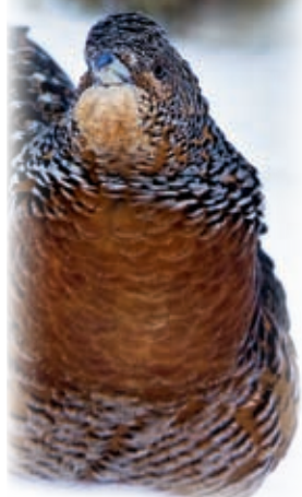
Autor: E. Marek