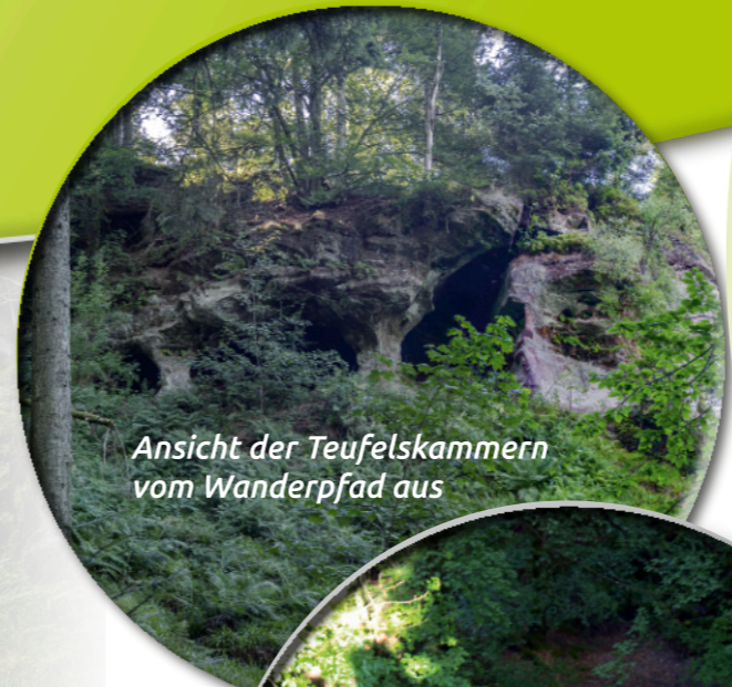
Ansicht der Teufelskammern vom Wanderpfad aus

Als der Mann heimkam, hatte er einen Goldreif rings um seinen Hut.