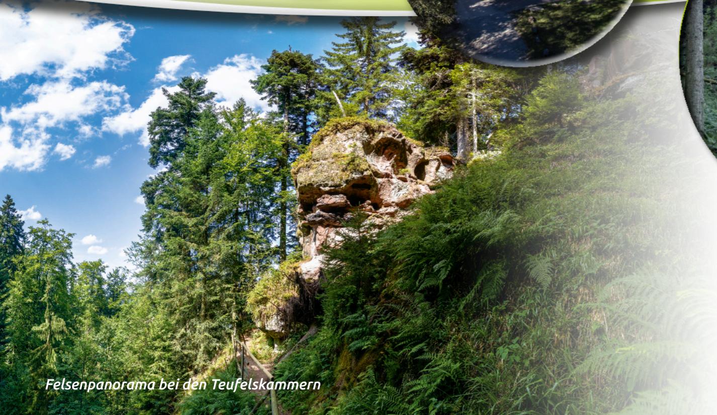
Felsenpanorama bei den Teufelskammern