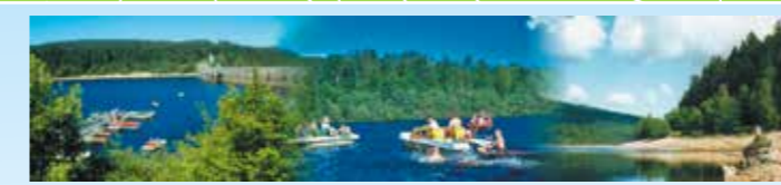
Genießen Sie ein erfrischendes Bad, machen Sie eine Bootstour oder versuchen Sie ihr Anglerglück. Viel Vergnügen!

Die Schwarzenbach-Talsperre, übrigens der größte See im Nordschwarzwald, ist eines der beliebtesten Ausflugsziele unserer Region. Neben einer herrlichen Umgebung zum Wandern und Radfahren lassen sich im Sommer auch zahlreiche andere Aktivitäten am See erleben.