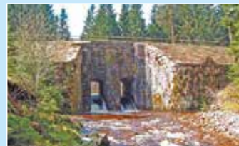
Ein technisch und kulturhistorisch sehenswertes Bauwerk ist die Herrenwieser Schwallung.

Die fast 70 m lange und mehr als 20 m breite Staumauer war eine wichtige Einrichtung zum Flößen von Holz auf dem Schwarzenbach. Mitte des 19. Jh. gebaut, ist sie ein beeindruckendes Zeugnis der früher für das Murgtal so bedeutenden Flößerei.