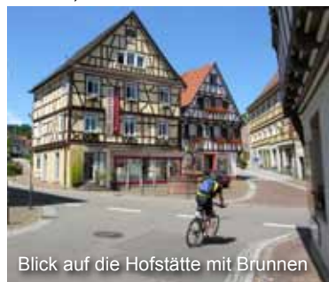
Blick auf die Hofstätte mit Brunnen

Hier reihten sich bis zu sechs Gasthäuser, wovon der Hirsch und die Traube zu den ältesten noch bestehenden gehören. 1387