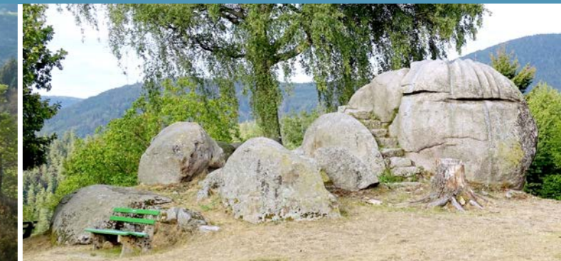
Die Giersteine bei Bernersbach