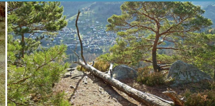
Auf dem Füllenfelsen

werden durch Gebirgsbildung und Vulkanismus erneut gehoben. In diesem Teil des Murgtals ist ein gewaltiges Granitmassiv vorhanden, etwa dreihundert Millionen Jahre alt. Granit ist ein magmatisches Tiefengestein, reich an Feldspat, Quarz und Glimmer. Das Schwarzwald-Granitmassiv weist verschiedene Formen auf. Der Bühlertal-Granit ist ein dunkles, grobkörniges Gestein. Der Forbachgranit ist eher rötlichgrau und von mittelkörniger Struktur. Und der Forbachgranit, dem wir hier begegnen, hat ein mittelbis grobkörniges Gefüge und ist grau bis rosafarben.