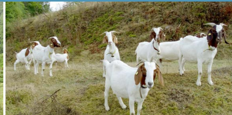
Ziegen in Bernersbach