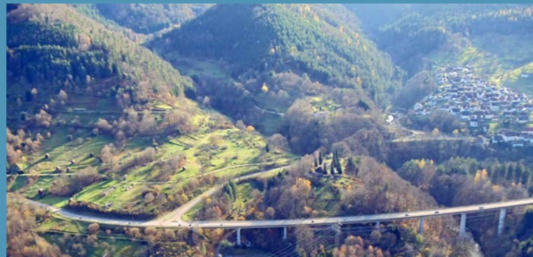
Blick vom Füllenfelsen auf das Murgtal und Langenbrand

Der Trail „Im Unteren Murgtal – Eine Wanderung von Weisenbach nach Forbach“ ist der dritte von insgesamt drei Natura Trails entlang der Murg, die wohl eines der aufregendsten Täler im Nordschwarzwald geschaffen hat.