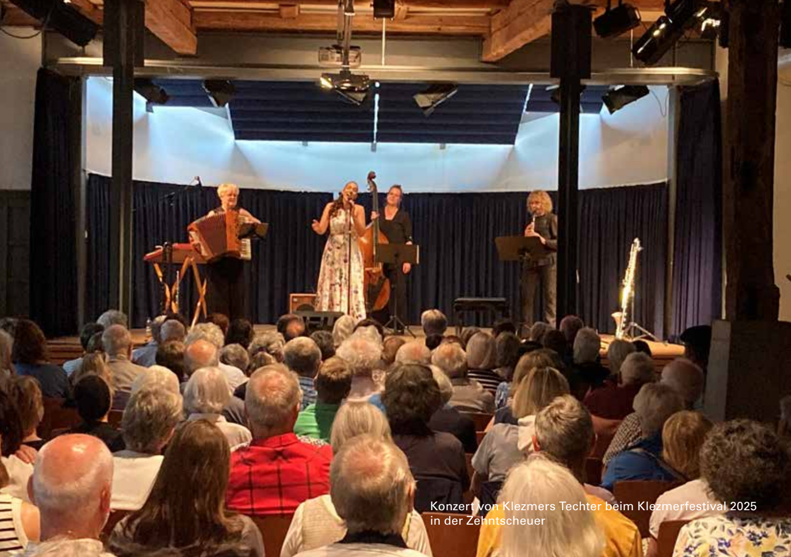
Konzert von Klezmers Techter beim Klezmerfestival 2025 in der Zehntscheuer