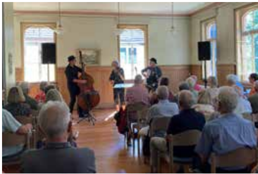
Eindrücke vom Klezmerfestival 2025

Bojos Papirosen Hamburger Klezmer Duo Haiducken