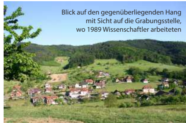
Blick auf den gegenüberliegenden Hang mit Sicht auf die Grabungsstelle, wo 1989 Wissenschaftler arbeiteten

Nach wenigen Metern zeigt ein Pfeil nach rechts zur Infotafel (3). Der Panoramaweg führt Sie durch ein Wiesengelände. Zu Ihrer Rechten haben Sie einen wunderschönen Blick auf die Dorfmitte und auf das Gelände der ehemaligen Stadt.