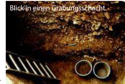
Blick in einen Grabungsschacht.

Im Vorfeld der Grabung suchten die Freiburger Wissenschaftler das Stadtgelände und dessen Umgebung sorgfältig ab und fanden mehr als 3000 Keramikscherben. Dabei handelte es sich zum überwiegenden Teil um Reste unterschiedlicher Gebrauchskeramik wie Teller, Schüsseln, Bügelkannen, Vorratsgefäße oder Becherkacheln. Alle konnten der sogenannten jüngeren Drehscheibenware des 12./13. Jahrhunderts zugeordnet werden. Bei der Grabung selbst kamen neben den Keramikscherben auch Bronzeobjekte wie Gürtelschnallen und Beschläge zum Vorschein. Als Stadt bestand Prinzbach nur relativ kurze Zeit. Bereits ab dem 15. Jahrhundert finden sich keine Hinweise mehr.