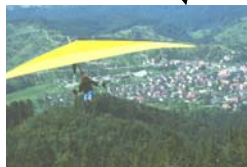
Drachenfliegen von der Teufelsmühle