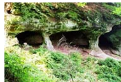
Naturhöhle „Großes Loch“