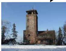
Teufelsmühle Aussichtsturm und Restaurant