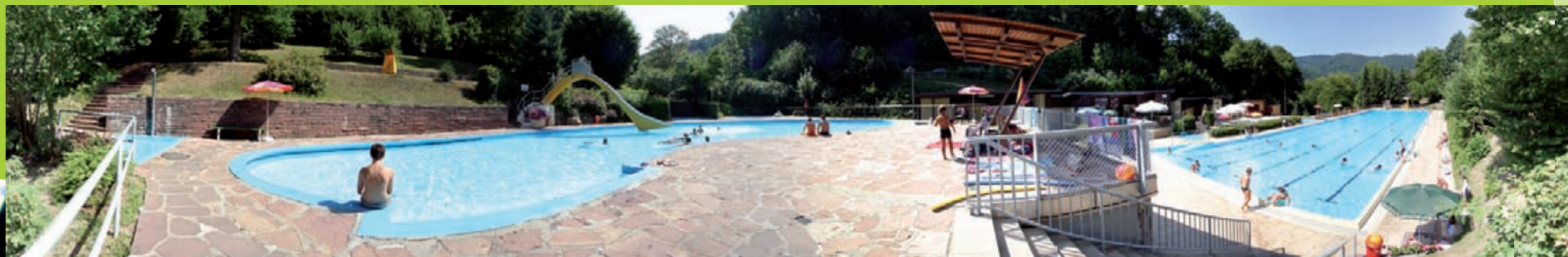
Rundumblick vom Nichtschwimmerbecken