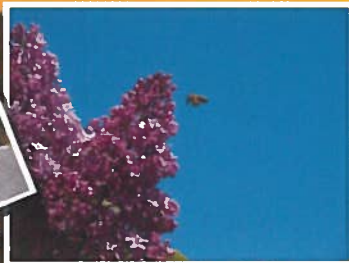
Biene bei der Arbeit