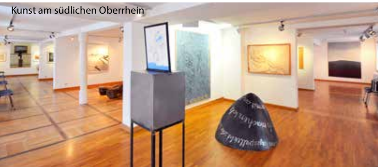
Kunst am südlichen Oberrhein