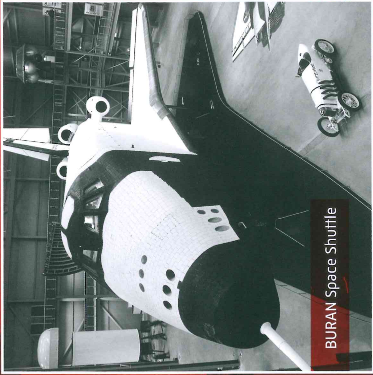
BURAN Space Shuttle