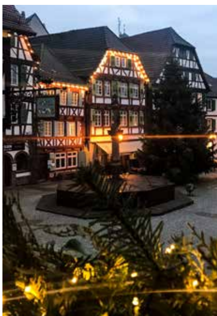
Foto oben links: Graf Eberstein Schloss in Kraichtal-Gochsheim (Niels Dick), oben rechts: Burg Ravensburg bei Sulzfeld (Thomas Rebel), Mitte links: Markt- platz in Bretten (Angela Keller), Mitte rechts: Schloß Eichersheim in Angel- bachtal (Niels Dick), unten links: Naturparkzentrum Stromberg-Heuchelheim (Dietmar Denger), unten rechts: Fachwerk in Eppingen (Christian Ernst)