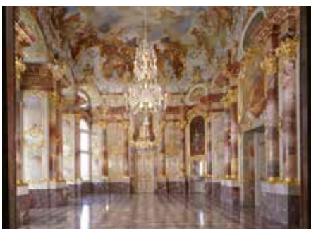
Marmorsaal Schloss Bruchsal

Tourist Information: Tel. 07251 505940, info@btmv.de www.bruchsal-erleben.de