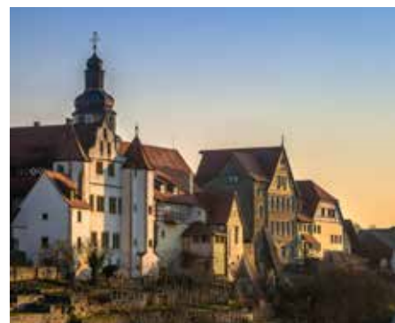
Graf Eberstein Schloss in Gochsheim – ein Ausflugsziel im Kraichgau, Seite 10-11.

hallo@meine-natur.de • www.meine-natur.de