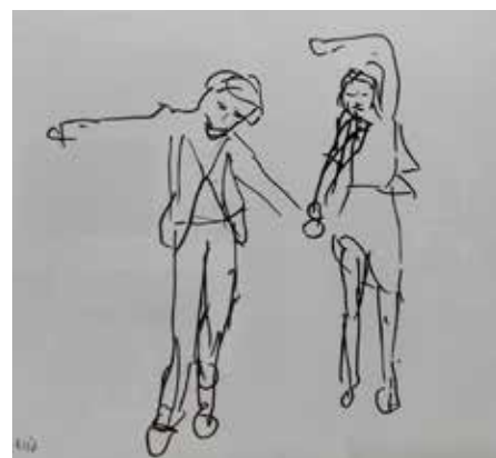
Zeichnungen von drei Kunstschaaffenden – zu sehen im Haus des Gastes, Seite 13.