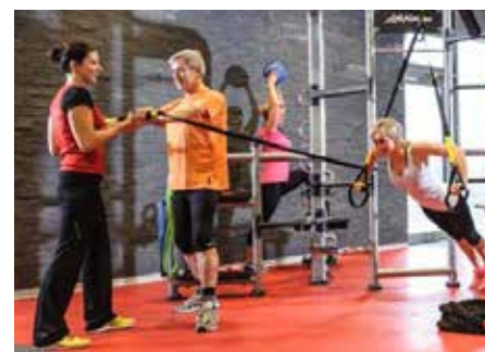
Fitness im Thermarium – mit der Tageskarte auch für Gäste lohnend, Seite 8-9.