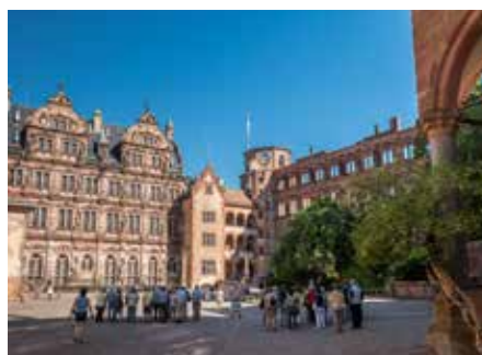
Innenhof Schloss Heidelberg

Tourist Information: Tel. 06221 5840244 touristinfo@heidelberg-marketing.de www.heidelberg-marketing.de