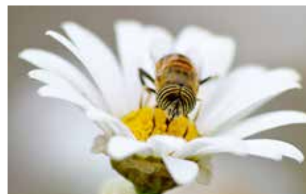
"Welt der Biene" – Mitmachen & Natur erleben im Sole-Aktiv-Park, Seite 10.