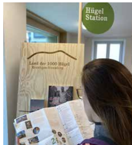
Hügelstationen – Infopunkte & Botschafter regionaler Kultur und Gastfreundschaft im Kraichgau, Seite 22.

hallo@meine-natur.de • www.meine-natur.de