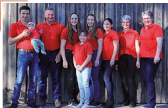
Rechts: Team des Gemüsehofs Kammerer in Graben-Neudorf, wo Spargel noch traditionell ohne Folie angebaut wird.