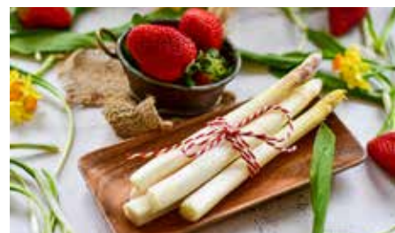
Frischer Spargel – genießen Sie das königliche Gemüse & Superfood in Bad Schönborns Restaurants, Seite 11.