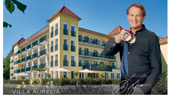
Zum Interview auf der Aktionsbühne ist der ehemalige deutsche Skirennläufer Markus Wasmeier, Markenbotschafter der Villa Aurelia, zu Gast