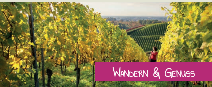
WANDERN & GENUSS