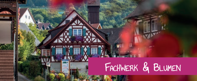
FACHWERK & BLUMEN