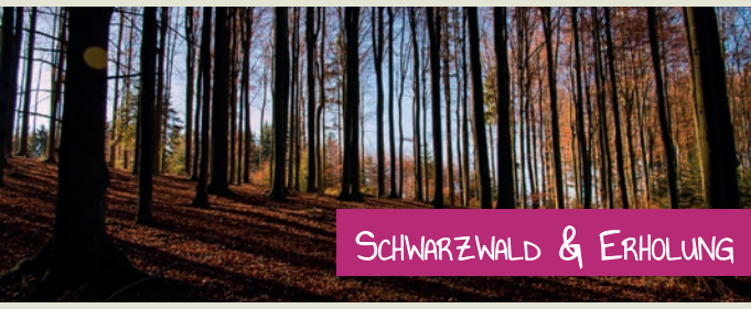
SCHWARZWALD & ERHOLUNG