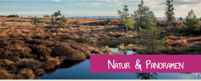
NATUR & PANORAMEN