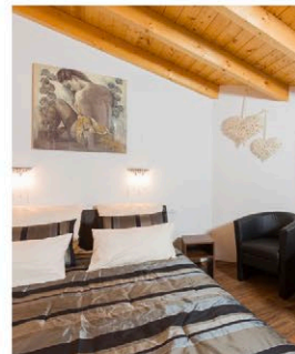
Abb.: ©reflectyourself/Gästehaus Kahl