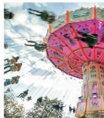
Abb.: © Woody T. Herner