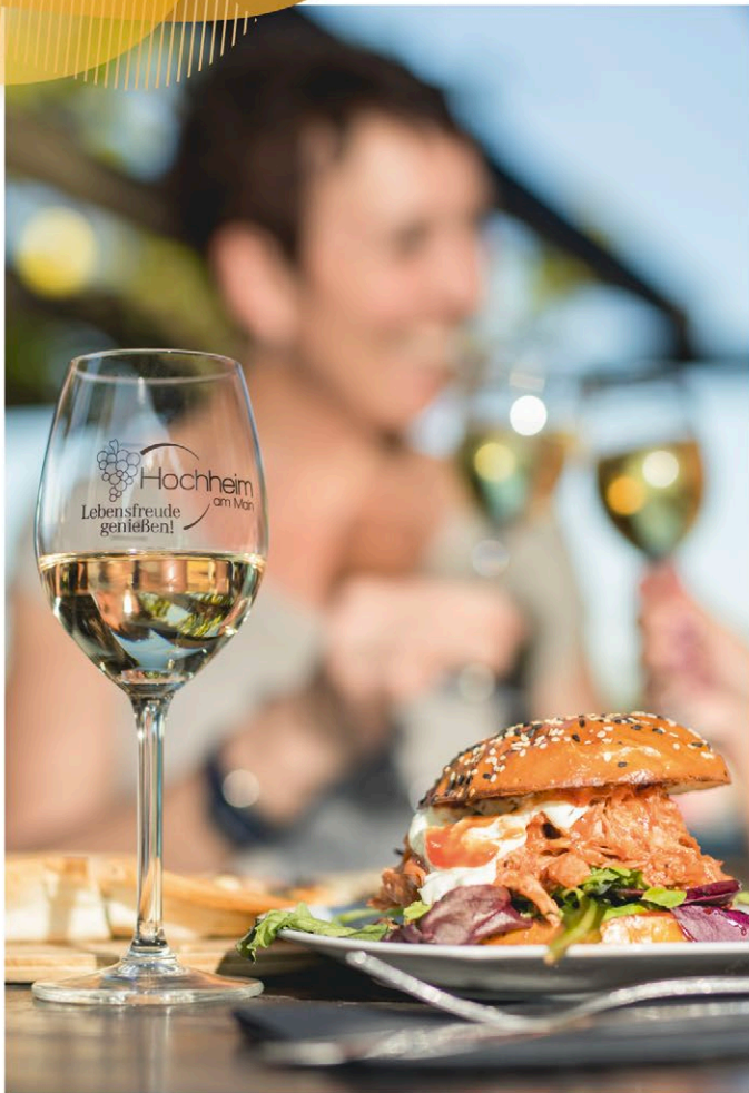
Abb.: © Woody T. Herner

Die „Hochemer“ haben eine Passion für Genuss und Lebensfreude.