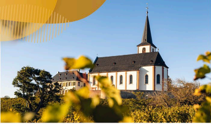
Abb.: © Woody T. Herner