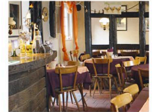
Abb.: © Gutsausschank „Zum Woiggel“

Neudorfstraße 8 65239 Hochheim am Main Tel.: 06146 7696 info@woiggel.de www.woiggel.de