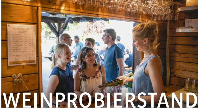
Abb.: © Woody T. Herner