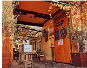
Abb.: © Weingut Preis

Rathausstraße 17 65239 Hochheim am Main Gutsausschank Tel.: 06146 9674 Weingut Tel.: 06146 7620 weingut@weingut-preis.de www.weingut-preis.de