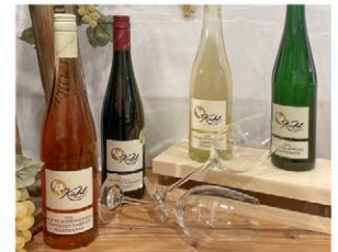
Abb.: © Weingut Kahl

Wickerer Straße 54 – außerhalb – 65239 Hochheim am Main Tel.: 06145 5480980 Fax: 06145 5480981 info@weingut-kahl.de www.weingut-kahl.de