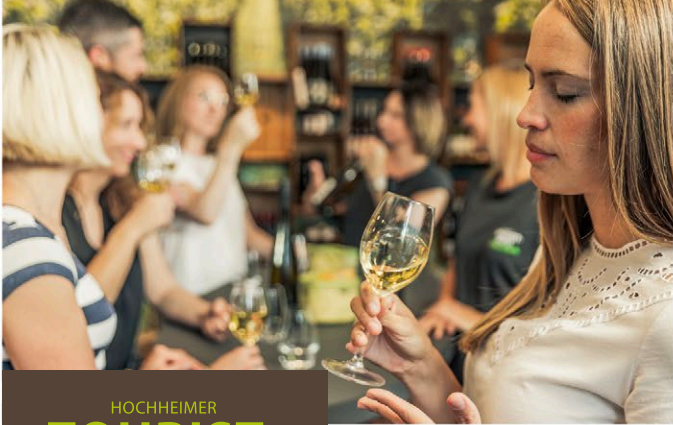
Abb.: alle TI-Bilder auf dieser Seite © Woody T. Herner