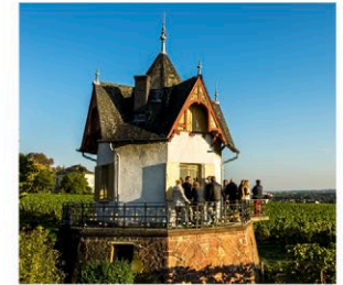
Abb.: © Falk Zimmer

Mainzer Straße 28 65239 Hochheim am Main daubhaeuschen@gmx.de www.daubhaeuschen.de Kontakt: Andreas Wolf Mobil: 0173 668 6218