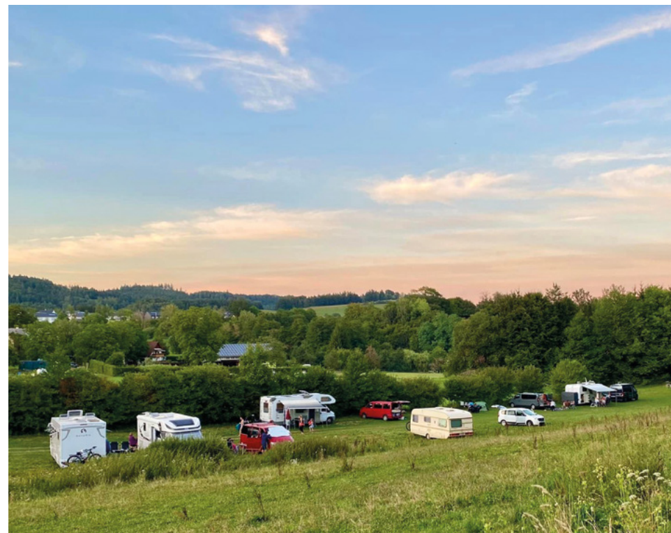
Camping am Pferdehof in Owingen

Bezahlung der Gebühr für die Übernachtung direkt vor Ort. Strom, Wasser sowie Möglichkeit zur Abwasserentsorgung sind vorhanden. Rasenschotter-Stellplatz belastbar bis 7,5 Tonnen. Fäkalienentsorgung, Müllentsorgung, in unmittel- barer Nähe findet sich das Caravancenter Bur- meister, die nächste Bäckerei ist 5 Gehminuten entfernt (auch sonntags geöffnet)