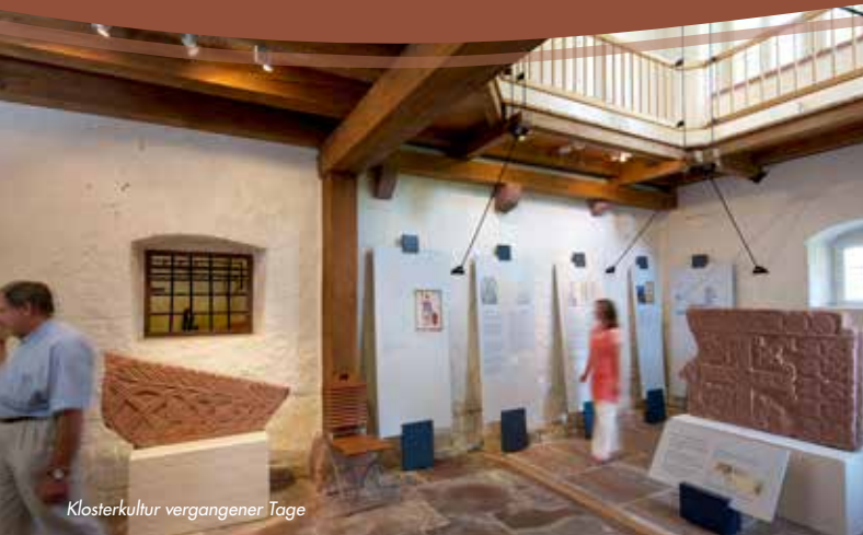
Klosterkultur vergangener Tage