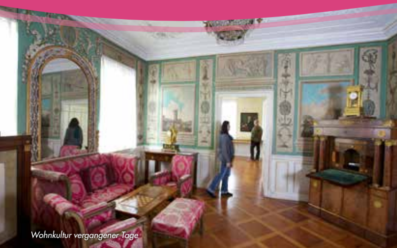
Wohnkultur vergangener Tage