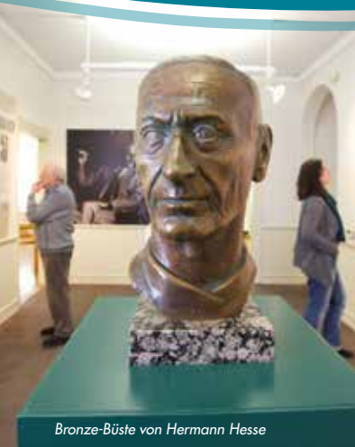
Bronze-Büste von Hermann Hesse