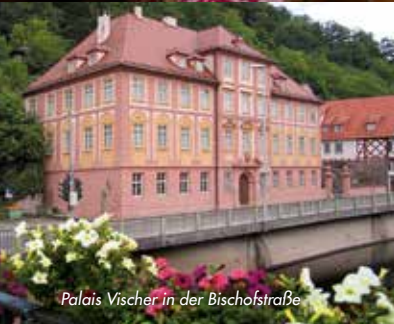
Palais Vischer in der Bischofstraße