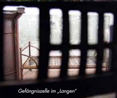
Gefängniszelle im „Lange“