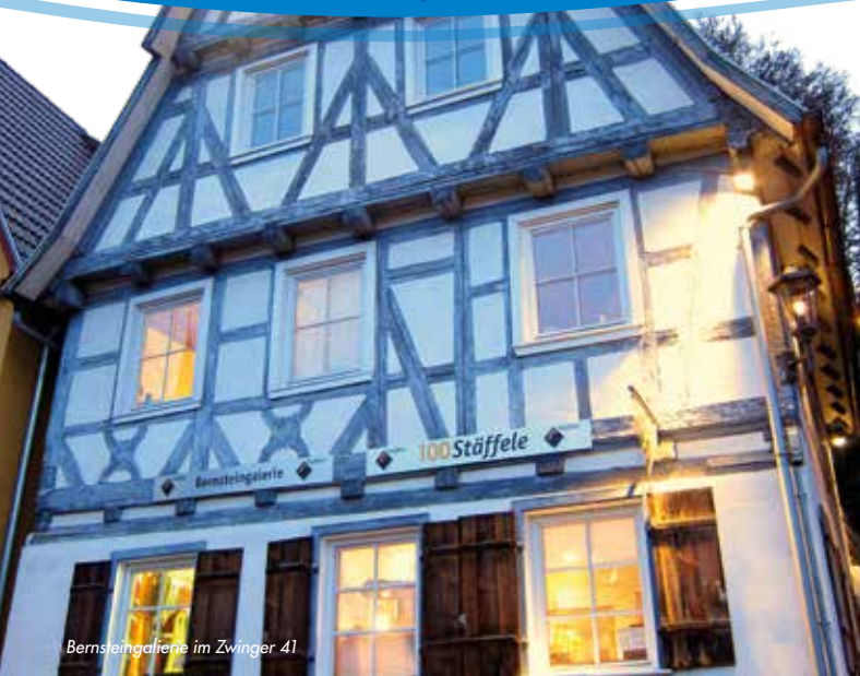
Bernsteingalerie im Zwinger 41