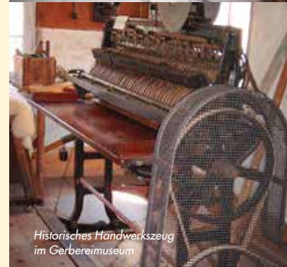
Historisches Handwerkszeug im Gerbereimuseum