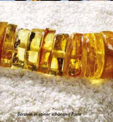
Bernstein in seiner schönsten Form

Wir beschäftigen uns seit mehr als 40 Jahren mit Bernstein und bieten in unserer Galerie in Calw eine große Auswahl an Schmuckunikaten und Kunstgegenständen aus Bernstein und Silber an.