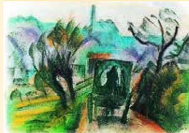
Richard Ziegler „Karren vor der Stadt“