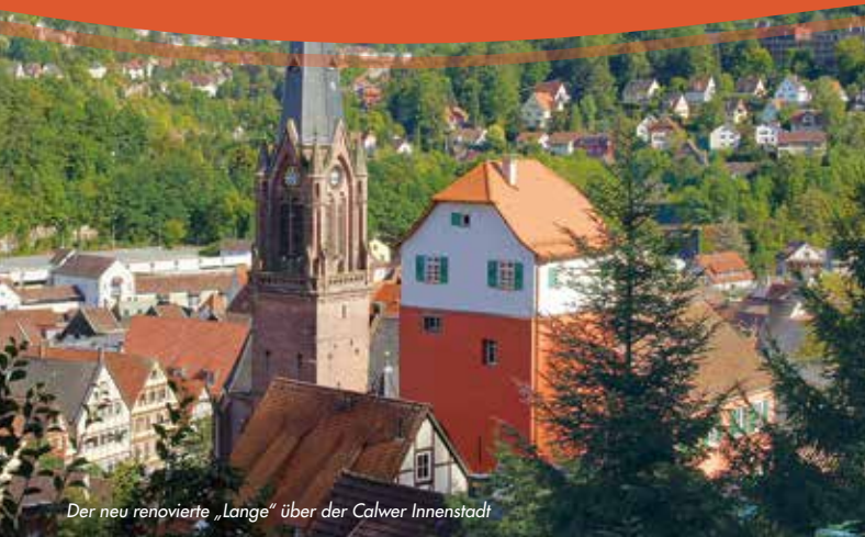
Der neu renovierte „Lange“ über der Calwer Innenstadt