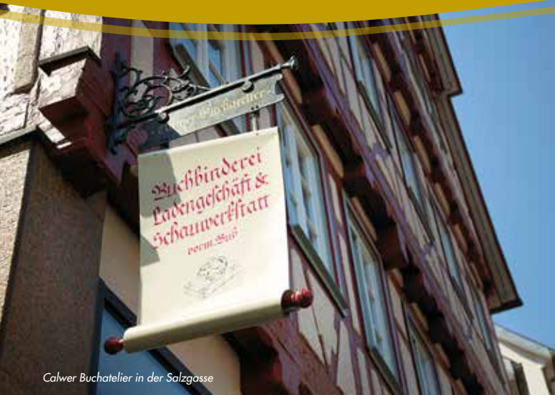
Calwer Buchatelier in der Salzgasse