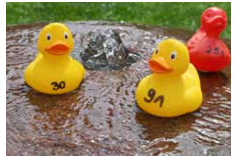
Großes Familienfestival im Sole-Aktiv-Park mit dem beliebten Entenrennen im Mühlbach, Seite 13.