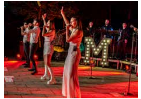
Musikalische Sternstunde mit Musicalhits und fulminanter Lichtershow am See, Seite 12.