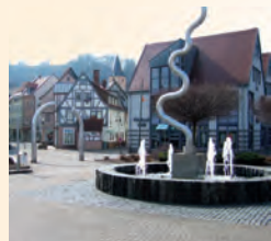
Stadteingang am Untertor mit Äskulapbrunnen