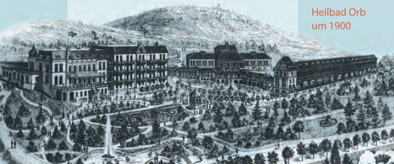
Heilbad Orb um 1900