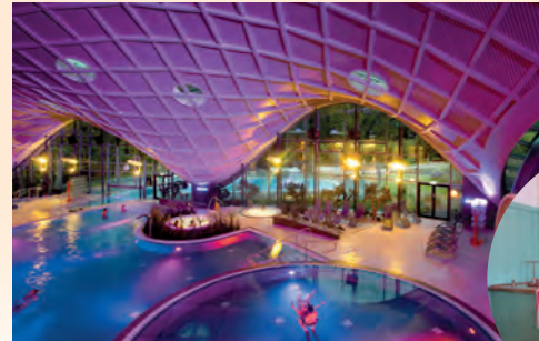
Toskana Therme – Baden in Musik & Licht

Um 1900 gelang es den Architekten und Gartenplanern, unter Erhaltung noch vorhandener Elemente des ehemaligen Salinengeländes, bei der Parkgestaltung ein einheitliches Gesamtwerk zu schaffen. Heute steht der Kurpark mit all seinen Gebäuden unter Denkmalschutz.