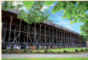
Das Gradierwerk heute