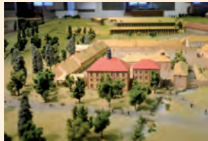
Modell der Saline um 1850

Das Erlebnisangebot ist vielseitig: Am Quellenring an der alten Stadtmauer erfahren Sie Interessantes über die geologischen Voraussetzungen der Orber Solequellen , ihre „Hebung“ aus der Tiefe der Gesteinsschichten und ihre natürliche Heilkraft. Im Kurpark lässt das mächtige, alte Gradierwerk die aufwändige Technik der historischen Salzgewinnung erahnen.