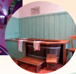
Eine alte Badezelle im Museum