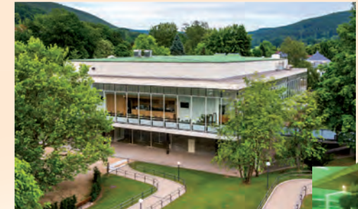
Die Konzerthalle – Veranstaltungszentrum im Kurpark

Wer noch mehr erfahren will, findet an den Informationsstationen zusätzliche Tipps und Anregungen zu Kur- und Kulturangeboten sowie Möglichkeiten der aktiven Freizeitgestaltung.