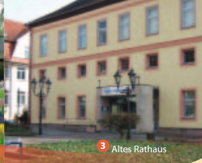
3 Altes Rathaus