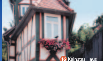
16 Kleinstes Haus

Gegenüber sehen Sie den am besten erhaltenen Teil der Stadtmauer 11 . Hier steht der einzige eckige Wehrturm, alle anderen elf waren halbrunde Türme mit Treppen als Aufgänge. Zinnen und Wehrgänge auf der Mauer gibt es heute nicht mehr zu sehen. Sie wurden bereits 1838 abgetragen. An dieser Stelle wurden beim Wiederaufbau nach einem Stadtbrand sogar die Scheunengiebel der Stadtmauer aufgesetzt, um eine Mauer zu sparen. Vom Torbogen aus, der 1959 eine Lücke in der Stadtmauer schloss, erkennt man, stark verflacht, noch den Verlauf des Wassergrabens, der einst die gesamte Stadtmauer umgab.