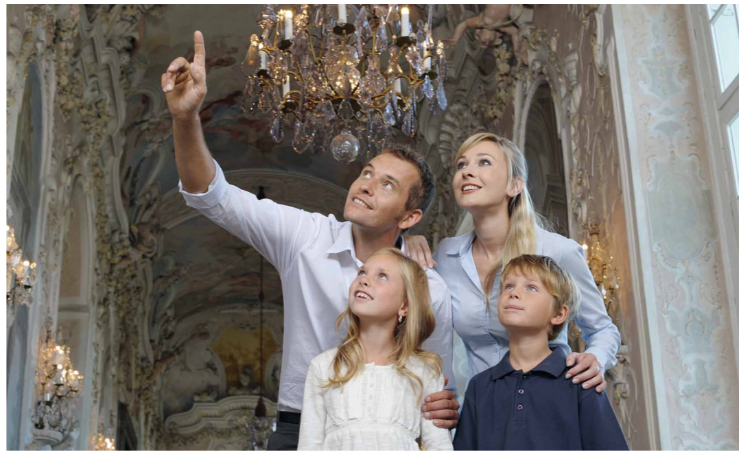
👑 Vom Licht durchflutet, gibt der Marmorsaal einen guten Eindruck vom Glanz des württembergischen Königshofs.