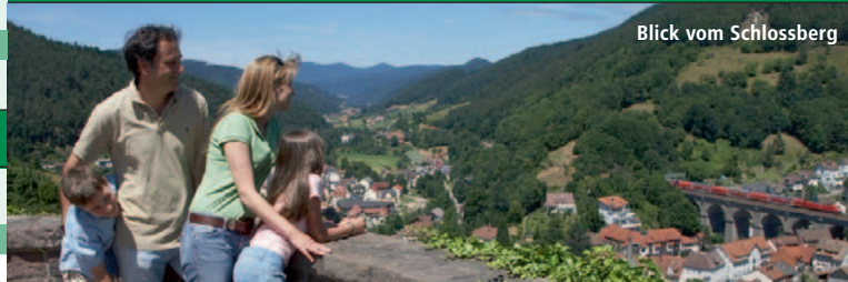
Blick vom Schlossberg

Mit Tänzen, Musik und anderen Vorführungen zeigt die Trachtengruppe des Historischen Vereins Hornberg auf dem Bärenplatz in der Innenstadt regionales Brauchtum. Eintritt frei. Mi. 27.06. + Mi. 18.07.2012, 19.30 Uhr (Bei schlechter Witterung fällt die Veranstaltung aus)