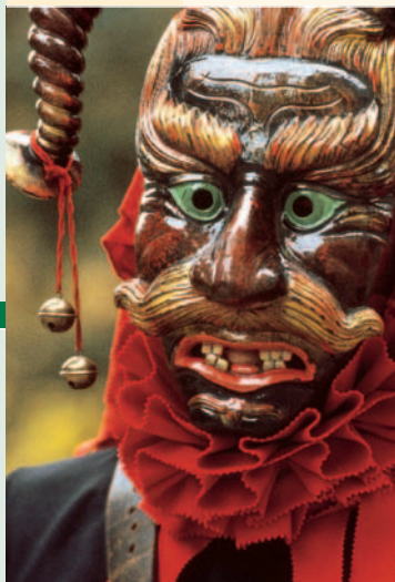
Maske in Hornberg