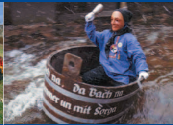
Guggemusik aus Schenkenzell