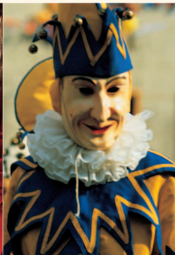
Maske in Wolfach