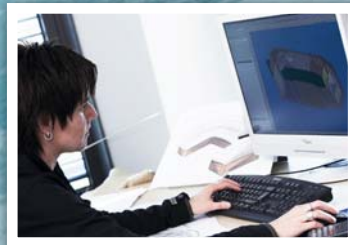
Das Familienunternehmen ist stolz auf die Treue seiner Mitarbeiter.