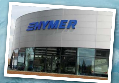
Immer in der Nähe: einer von weltweit über 450 HYMER-Handelspartnern.

„ Mit unseren Clubs, den geführten Reisen an exotische Plätze oder den Routenvorschlägen für Individualisten möchten wir einfach etwas mehr bieten – ein Mehr an Service und Austausch. Bunt und vielfältig, wie die Welt nun mal ist! „