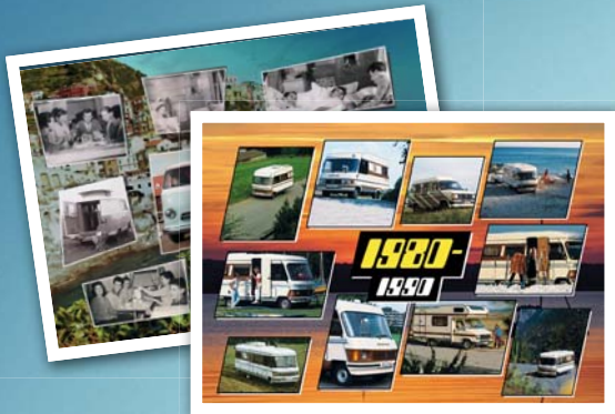
Ein einzigartiges Jubiläum 2011: 50 Jahre HYMER-Reisemobilbau.

Ein Hytermobil lässt keine Wünsche offen. Aber in Sachen Service möchte HYMER trotzdem auf Nummer sicher gehen. So bekommen unsere Kunden jederzeit genau die Hilfe, die sie brauchen: Neben einer vorbildlichen Betreuung und einem großen Händlernetz kann jeder Kunde auch immer auf die aktive und gut organisierte HYMER-Gemeinschaft zurückgreifen. So wird jeder Neukunde meist selbst schnell zum echten Hymeristen.