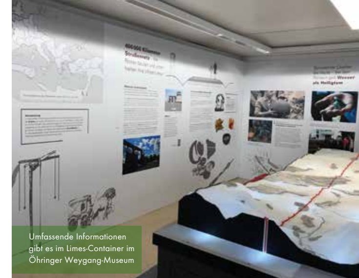
Umfassende Informationen gibt es im Limes-Container im Ohringer Weygang-Museum