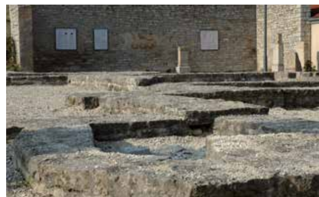
Kastellbad Jagsthausen