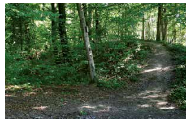
Wall und Graben im Wald bei Zweiflingen, am Pfahldöbel