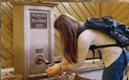
8 ▲ Wanderverein Frohsinn Oberwürzbach