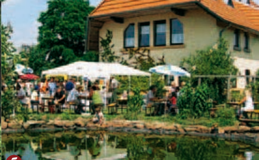
5 ▲ Wanderbütte Hof Hochscheid

bergab Richtung Hassel. Am Ende des pfadigen Weges erblicken wir links die Schoppühelbütte 3 der Hasseler Wander- und Naturfreunde mit ihrem einladenden Biergarten. Unter schattigen Bäumen lässt sich hier die „süße Spezialität des Hauses“, der Bienenstich mit einem schönen Kaffee genießen.