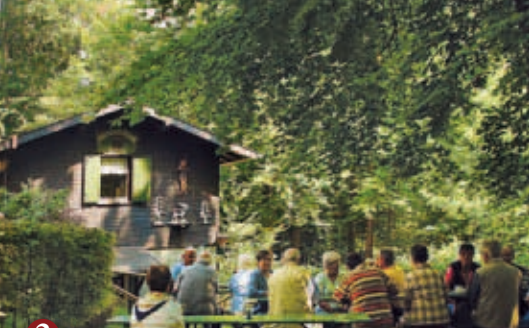
3 ▲ Schoppühelbütte