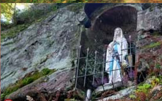
7 ▲ Lourdes-Grotte