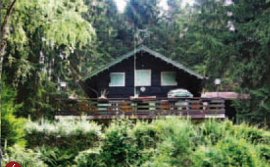
4 ▲ Kahlenberghütte