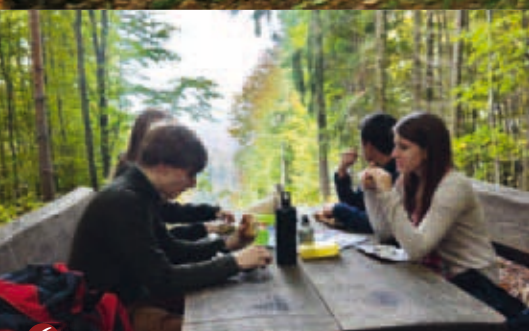
6 ▲ Rastplatz Weidenberghütte

Der Wanderweg führt weiter bergauf, auf der Anhöhe geradeaus und anschließend rechter Hand bergab zur Hütte des Wandervereins Frohsinn Oberwürzbach , 8 einem weiteren schönen Rastpunkt mit Freisitz. Von hier führt der Weg vor der Hütte links leicht bergauf. Der Weg schlängelt sich am Hang entlang, macht eine Rechtskurve und stößt schließlich auf die Straße zum Friedhof, der wir rechts abwärts zurück zur Oberwürzbachhalle folgen.