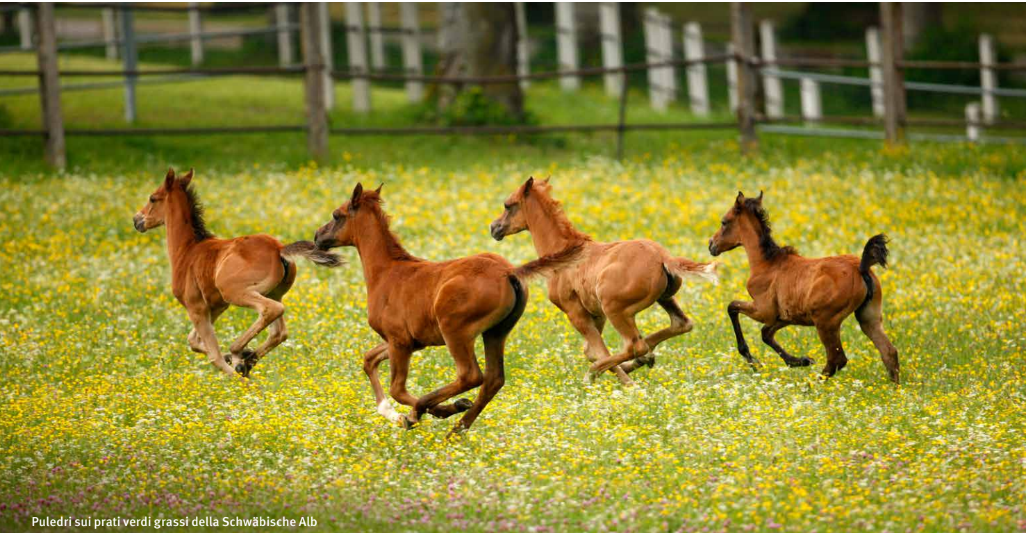
Puledri sui prati verdi grassi della Schwäbische Alb

Campione olimpionico Michael Jung con Halunke FBW del Marbacher concorso completo di equitazione.