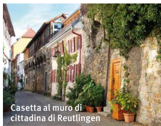
Casetta al muro di cittadina di Reutlingen