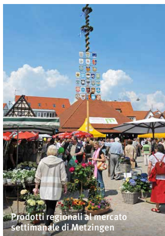
Prodotti regionali al mercato settimanale di Metzingen

Il bufalo del Alb offre carne, formaggio «albzarella», saponi, articoli di pelle.