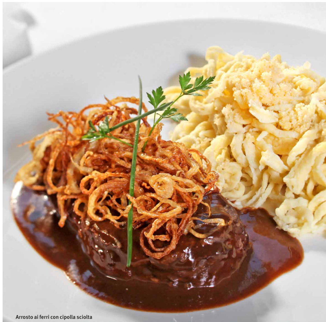
Arrosto ai ferri con cipolla sciolta

Lenticchie con würstel «saiten» e arrosto ai ferri con cipolla svevo sono servite con le «spätzle» (tipo di pasta a base di farina e uova).