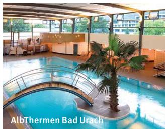
AlbThermen Bad Urach