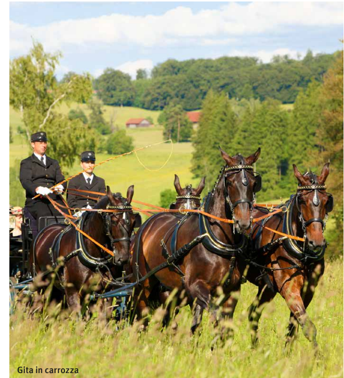
Gita in carrozza