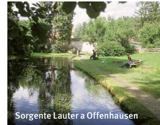
Sorgente Lauter a Offenhausen

Scoperte archeologiche come la finora più vecchia opera d'arte sconosciuta e strumento di musica del età della pietra, o gioielli celtici, castelli e roccaforti di età più giovani sono testimoni di una lunga storia delle persone sulla Alb www.geopark-alb.de