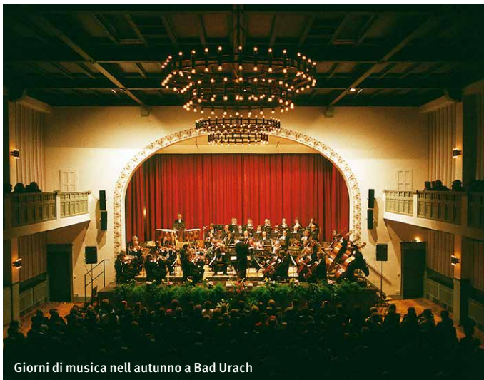
Giorni di musica nell'autunno a Bad Urach

La outletcity Metzingen, attrazioni culturali nella nuova hall della città di Reutlingen o forse un giorno di wellness nelle terme di Bad Urach? Nella città natale del marchio Hugo Boss con tanti altri prodotti top di marca nessun desiderio rimane insoddisfatto. La nuova hall della città di Reutlingen conquista l'ambiente culturale con musicals, concerti in gran gala, balletto classico e cabaret. Nelle Alb terme di Bad Urach vi aspettano culmini di wellness.