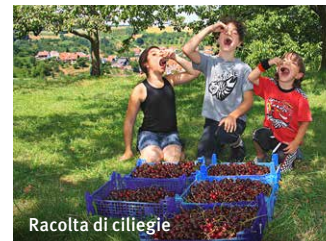
Racolta di ciliegie