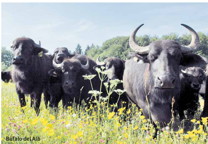
Bufalo del Alb

Il bufalo del Alb offre carne, formaggio «albzarella», saponi, articoli di pelle.