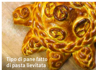
Tipo di pane fatto di pasta lievitata