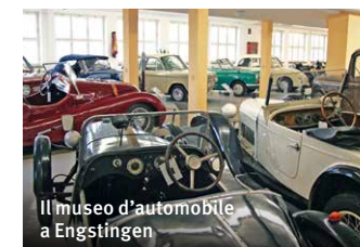
Il museo d'automobile a Engstingen

Il museo d'automobile a Engstingen con all'incirca 140 auto depoca.