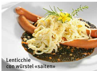
Lenticchie con würstel «saiten»

La «mutschel» di Reutlingen e un tipo di pane a forma di stella fatto di pasta lievitata.