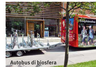
Autobus di biosfera