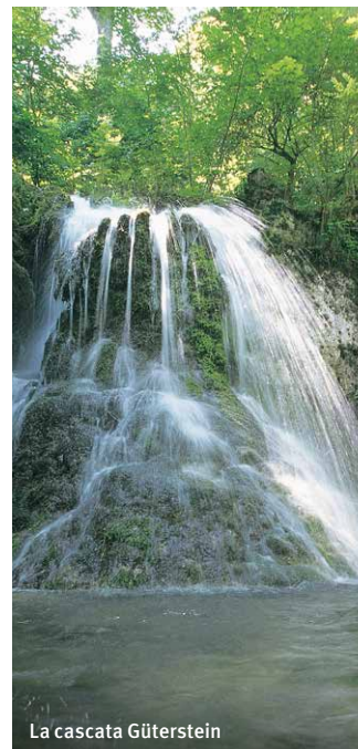
La cascata Güterstein

Più di 240 proposte di cammini si trovano su internet al sito: www.mythos-alb.de/karte o nell nostro app Mythos Schwäbische Alb App.