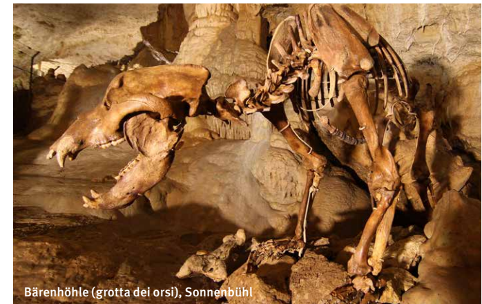
Bärenhöhle (grotta dei orsi), Sonnenbühl