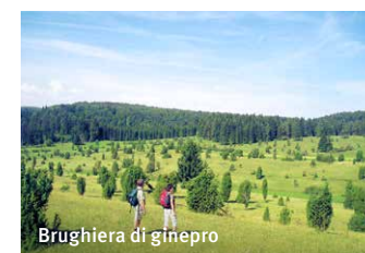
Brughiera di ginepro