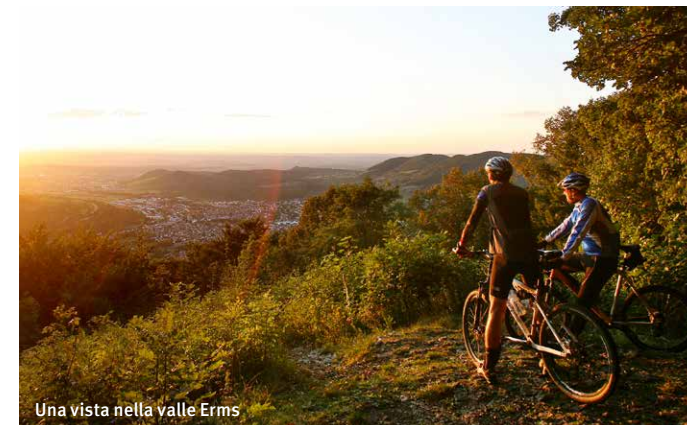
Una vista nella valle Erms