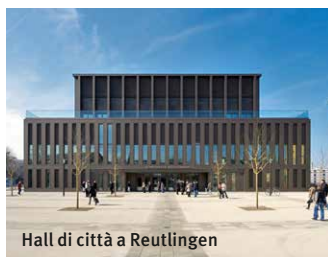
Hall di città a Reutlingen