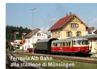
Ferrovia Alb Bahn alla stazione di Münsingen