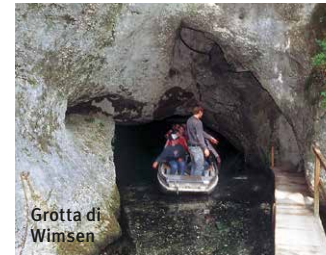
Grotta di Wimsen