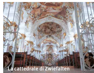
La cattedrale di Zwiefalten

In più di 25 anni fu costruita la cattedrale di Zwiefalten, Nell 1765 fu consacrata.