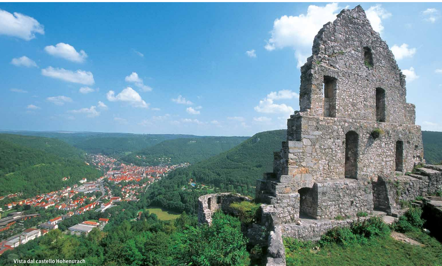
Vista dal castello Hohenurach

Incontrare la storia ad ogni passo. Rovine di castelli imponenti, il castello romantico di Lichtenstein, la cattedrale barocca di Zwiefalten oppure le pittoresche cittadine come Bad Urach, Münsingen, Hayingen o Trochtelfingen incantano ospiti e nativi, numerosi musei mostrano come vivevano, lavoravano e festeggiavano le persone in tempi passati.