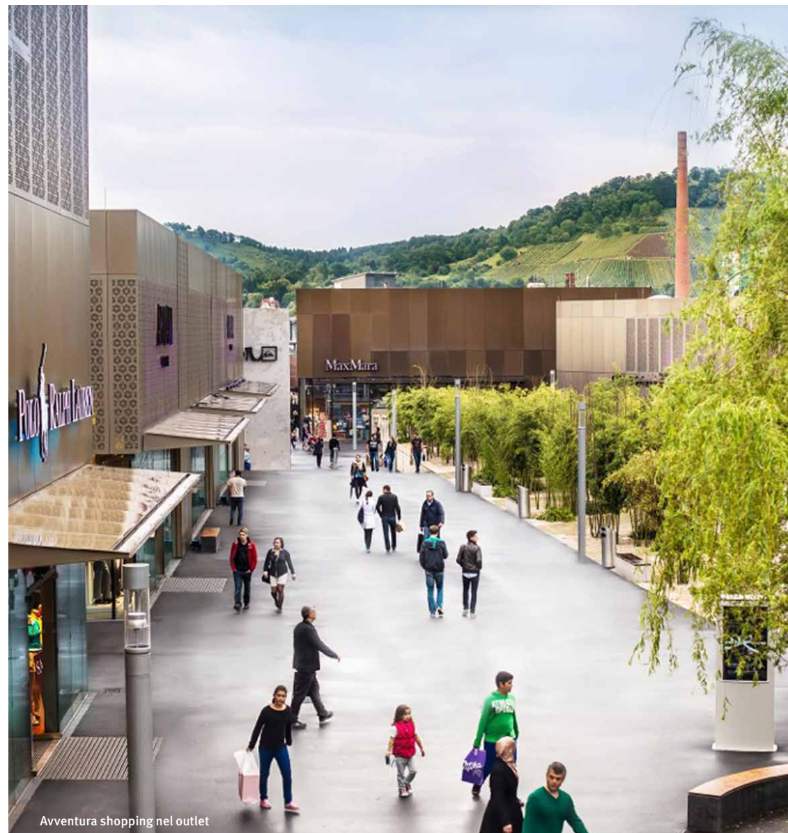
Avventura shopping nel outlet

La outletcity di Metzingen è una delle destinazioni più importanti internazionali del mondo per lo shopping con più di 3 milioni di visitatori all'anno.