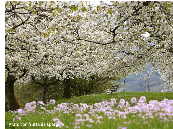
Prato con frutta da spargere