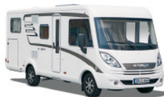
HYMER Exsis-i Fiat