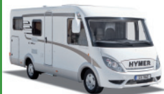
HYMER Exsis-i Ford