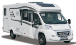
HYMER Tramp CL