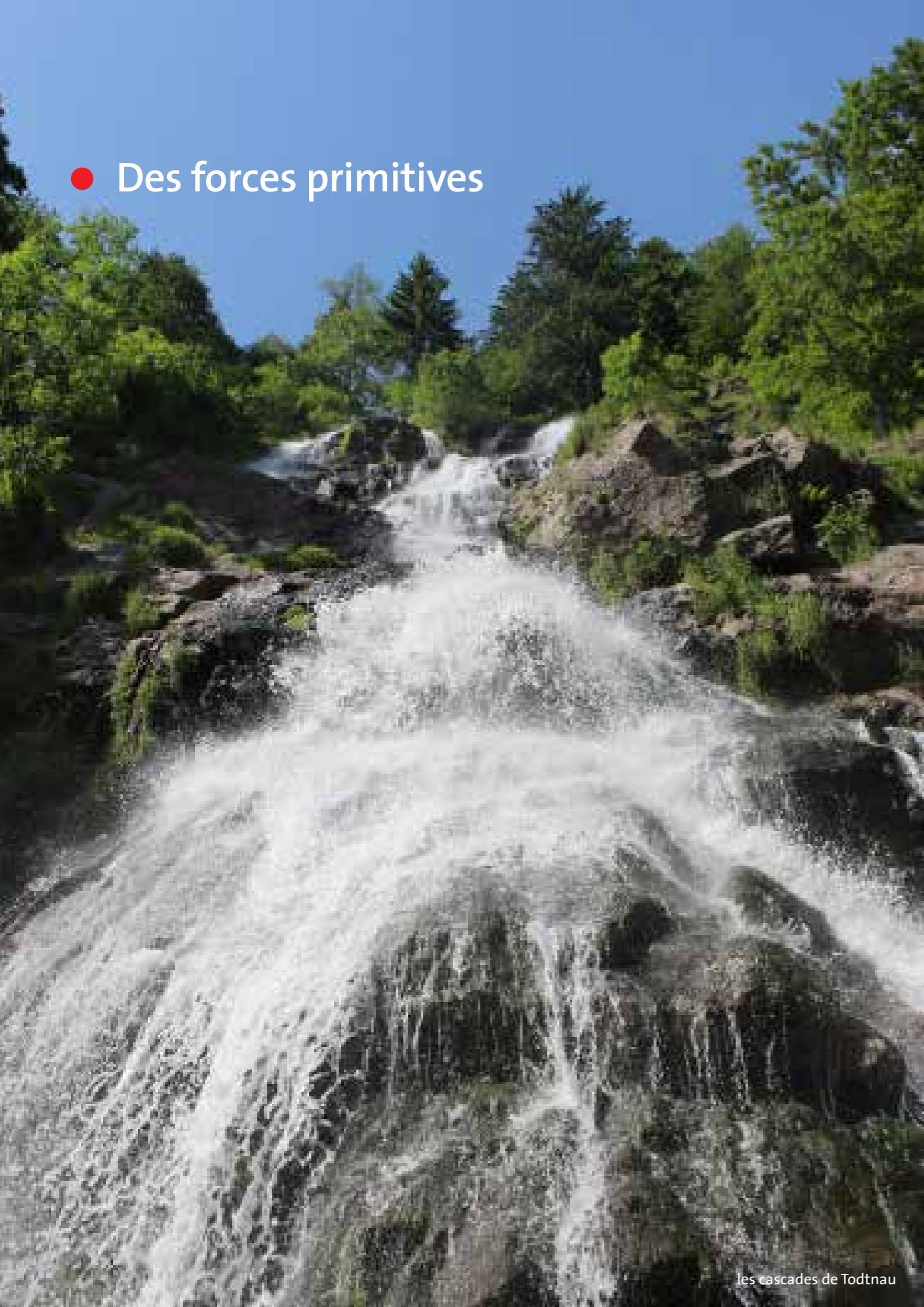
les cascades de Todtnau