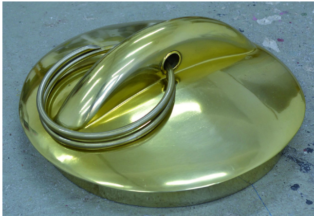
Bildnachweis: Jürgen Drescher, Caster Plug, 2012

Bis 1. April 2013 | Badischer Kunstverein Karlsruhe | www.badischer-kunstverein.de