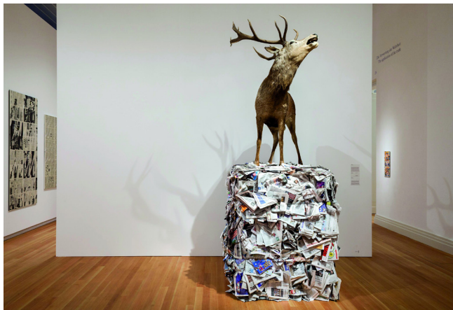
bis zum 10. März 2013 | ZKM | Zentrum für Kunst und Medientechnologie | www.zkm.de