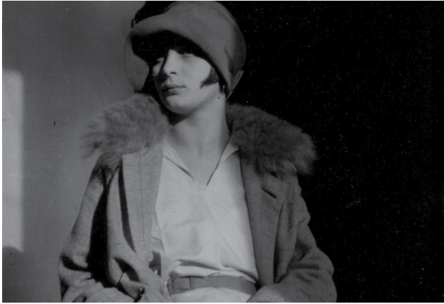
Bildnachweis: Karl Hubbuch, Martha im Atelier, um 1927, Städtische Galerie Karlsruhe

9. März bis 9. Juni 2013 | Städtische Galerie Karlsruhe | www.staedtische-galerie.de