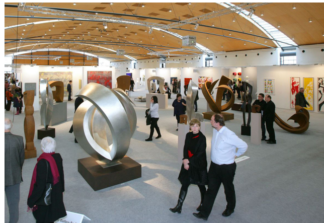
7. bis 10. März 2013 | Messe Karlsruhe | www.art-karlsruhe.de

Ein Blick auf die Kunstgeschichte der letzten 200 Jahre zeigt eine enge Vernetzung von Kunst und Presse. Kunst und Zeitung begegnen sich in ihrem Willen zur Nachfrage, zur Klärung, zur Infragestellung. Den Anspruch, die Realität möglichst authentisch abzubilden □ objektiv, subjektiv und mithin als reine Behauptung □ verbindet Zeitungsarbeit und künstlerisches Schaffen. Presse schafft Öffentlichkeit, Kunst braucht Öffentlichkeit. Eine Abhängigkeit, die dem Medium Zeitung bis heute einen Platz innerhalb der Kunst einräumt.