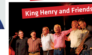
King Henry and Friends