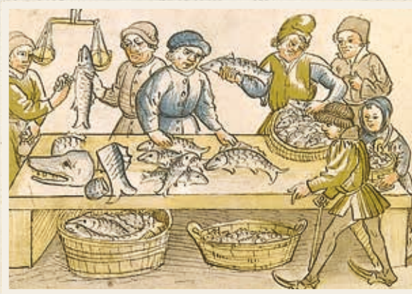
Aus der Chronik von Ulrich Richental