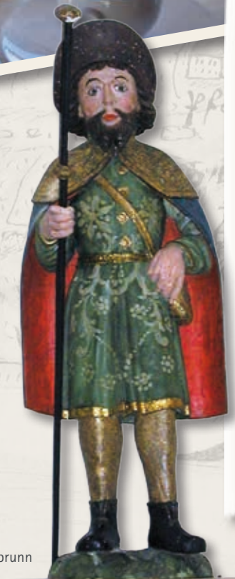
Der heilige Jakobus, Jakobuskapelle Kaltbrunn