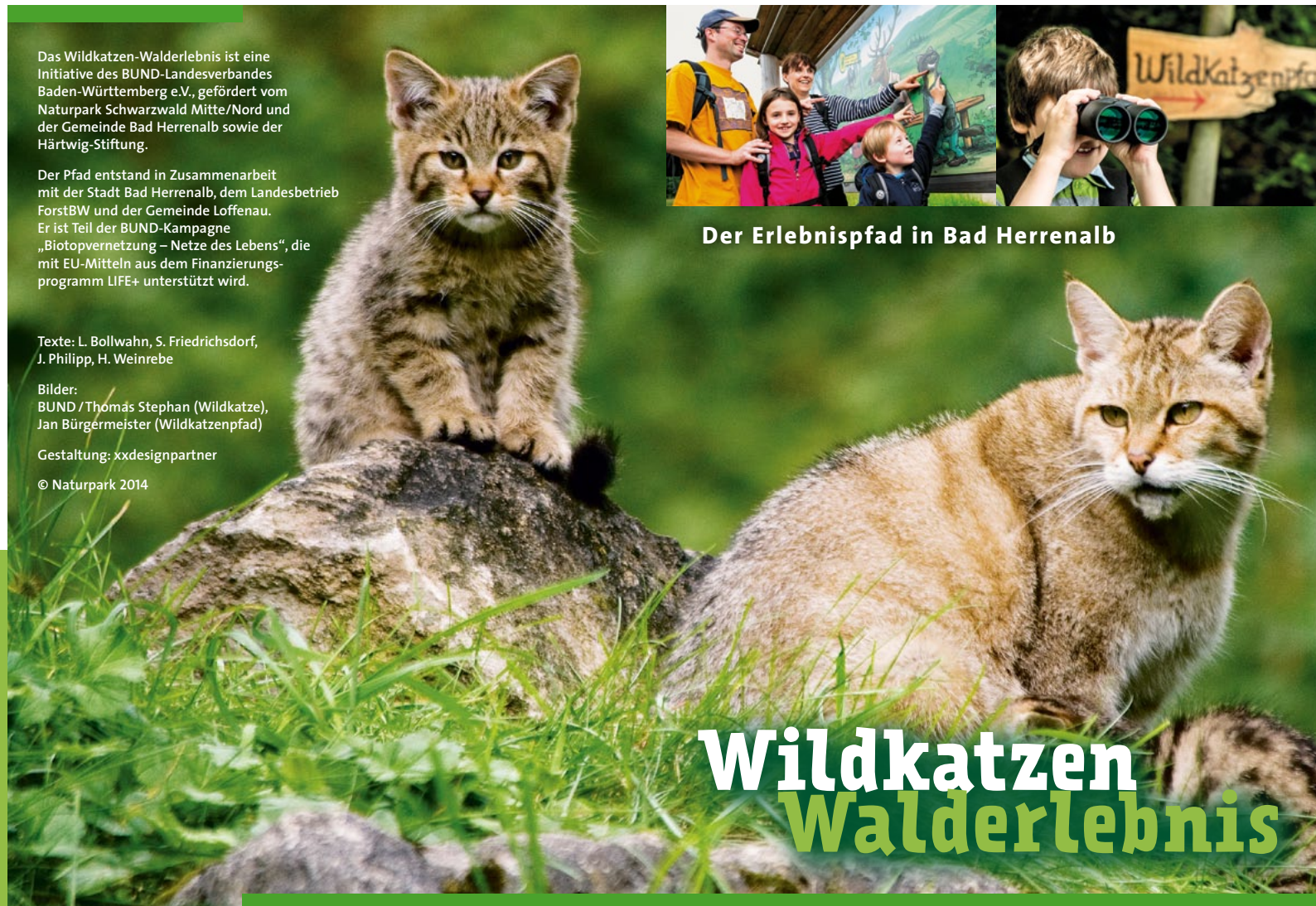
Der Erlebnispfad in Bad Herrenalb